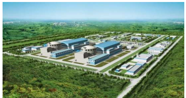
高温ガス炉実証炉（左）とHTGRの商業化に向けた後続プロジェクトのイメージ図